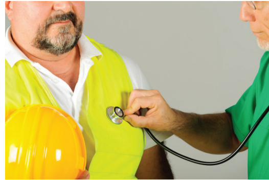
تیم معاینات طب صنعتی، معاینات ۱۸۰ نفر از کارکنان استان آذربایجان غربی را به انجام رساند

به گزارش پایگاه اطلاع رسانی بهداشت و درمان صنعت نفت شمالغرب کشور، تیم معاینات طب صنعتی این بهداشت و درمان جهت انجام معاینات سالانه شغلی کارکنان به استان آذربایجان غربی عزیمت نمود.