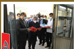
بهره برداری از آزمایشگاه تست سلوله مولکولار در بندرماهشهر