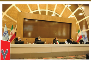
حضور مدیرعامل سازمان در هشتاد و سومین جلسه شورای راهبردی شرکت های منطقه ماهشهر