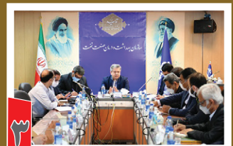
برگزاری اولین نشست شورای تخصصی امور استراتژیک و بین الملل سازمان