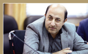
فعالیت ۳۵ مرکز مشاوره بهداشت و درمان صنعت نفت در سطح کشور