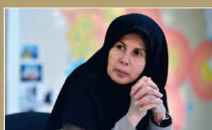
هدف بسته‌های خدمتی پزشکی خانواده، پیشگیری و کنترل عوارض بیماری است