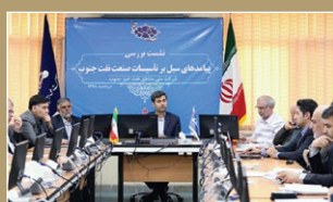
نفت در مدیریت سیل خوزستان نمره قبولی گرفت