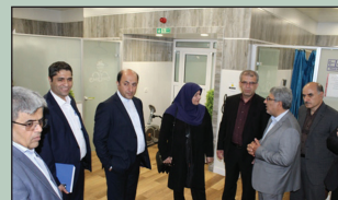
اهواز میزبان اولین جلسه هیئت مدیره سازمان در سال جدید