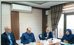
کار ارزشمند بهداشت و پیشگیری قابل خریدن نیست