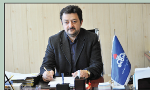
ارتقاء سلامت و کاهش هزینه‌های درمانی دندانپزشکی با اجرای طرح سلامت دهان و دندان