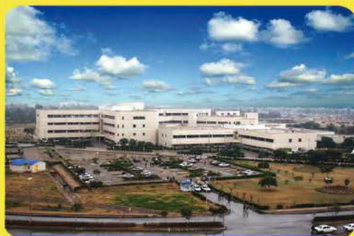
بیمارستان بزرگ صنعت نفت اهواز

به طور کلی درمان های پروتزی، پرهزینه ترین درمان های دندانپزشکی هستند.