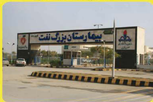
بیمارستان بزرگ صنعت نفت اهواز

روابط عمومی سازمان بهداشت و درمان صنعت نفت به صورت شبانه روزی آماده دریافت هرگونه انتقاد و پیشنهاد می باشد