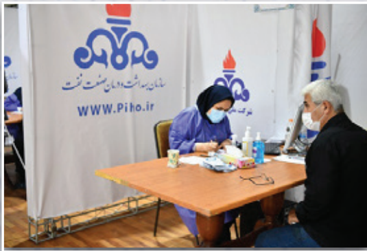
۲۵ دستگاه ونتیلاتور در اختیار بهداشت و درمان نفت