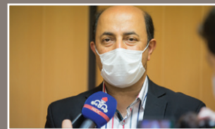
بخش PCR بیمارستان نفت تهران به زودی راه اندازی می شود