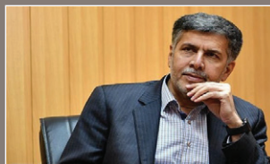
دکتر دهقان: توسعه امکانات و تجهیزات در بهداشت و درمان صنعت نفت اهواز