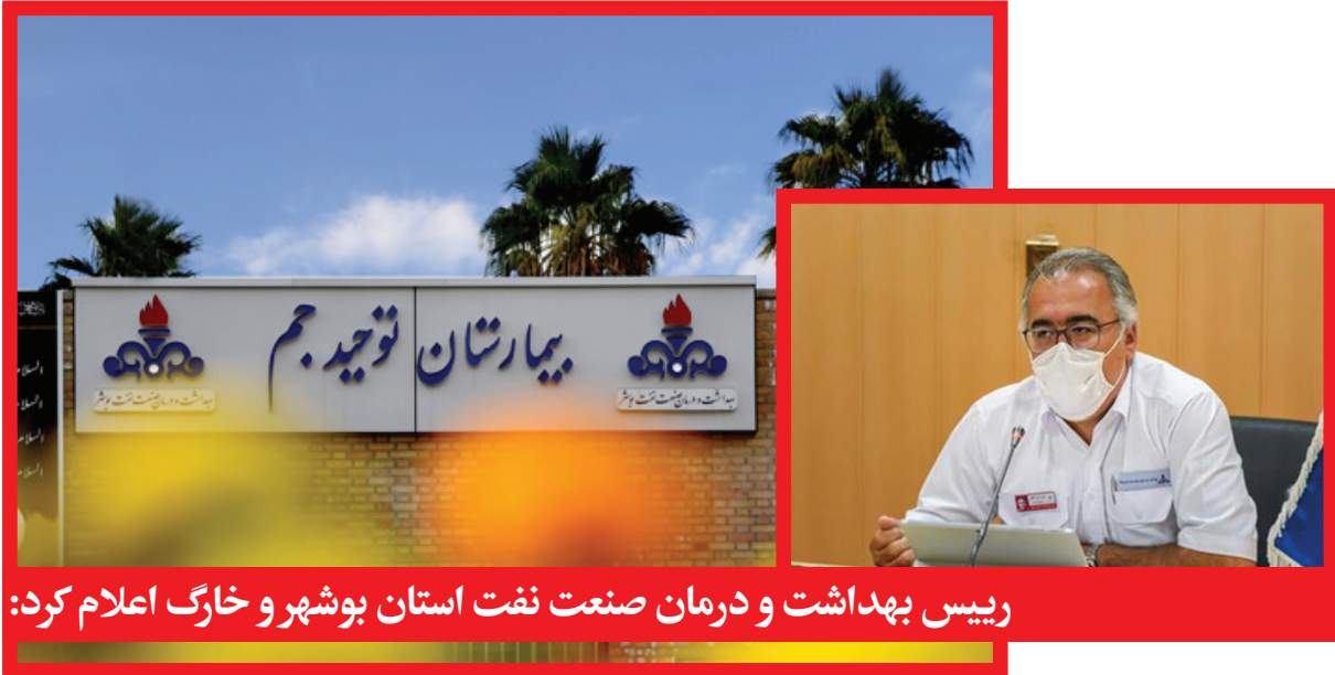
رئیس بهداشت و درمان صنعت نفت استان بوشهر و خارگ اعلام کرد: