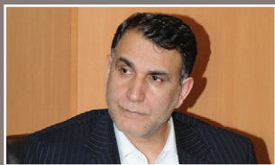
شناسایی افراد پرخطر و راه اندازی سیستم CallCenter