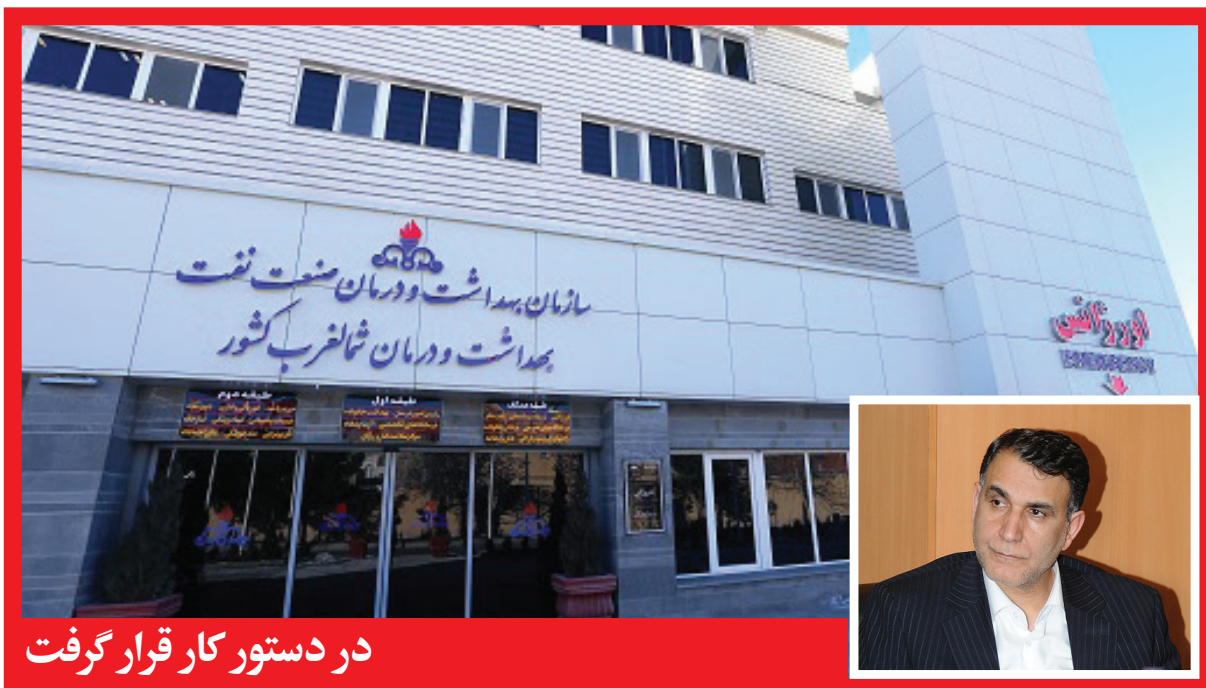
در دستور کار قرار گرفت