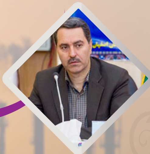
اصفهان پیشرو در ارتقا سلامت روان کارکنان صنعت نفت