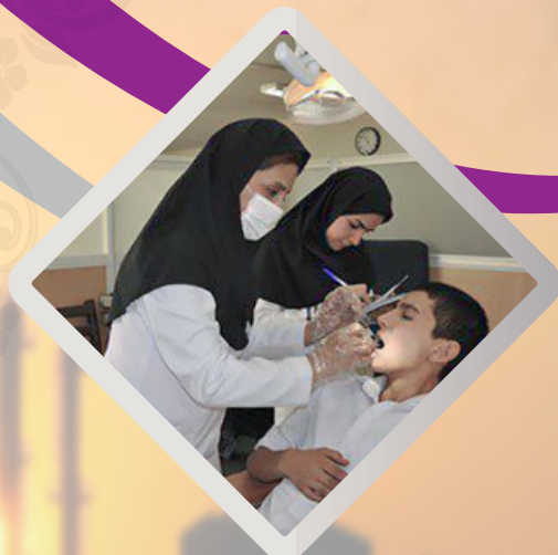
اجرای موفق طرح سلامت دهان و دندان در شمال شرقی کشور