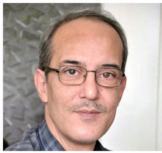
بعنوان سرپرست واحد فناوری اطلاعات و ارتباطات سازمان منصوب شدند.