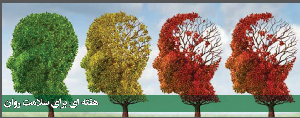
هفته ای برای سلامت روان