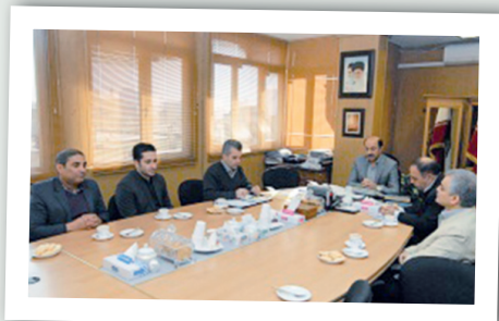
عملکرد واحد بازرسی سازمان بهداشت و درمان بررسی شد