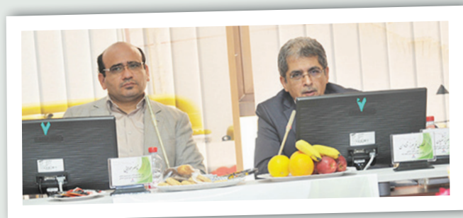
بهداشت و درمان هرمزگان میزبان سی و پنجمین نشست مشترک ادارات برنامه ریزی نیروی انسانی شرکت ملی نفت ایران