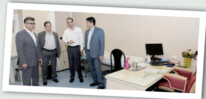
بازدید مدیران برنامه ریزی و مهندسی سازمان از بهداشت و درمان صنعت نفت بوشهر

خبرنامه الکترونیکی سازمان بهداشت و درمان صنعت نفت ■ سال اول ■ آذر ۹۴ ■ شماره ۱۲