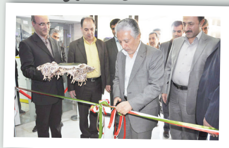
همزمان با هفته بسیج پلی کلینیک تخصصی توحید افتتاح شد