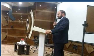
حضور رئیس بازرسی سازمان در منطقه آغاچاری