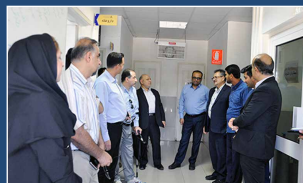
خدمات بهداشت و درمان نفت برای کارکنان عملیاتی اروندان ارتقایی یابد