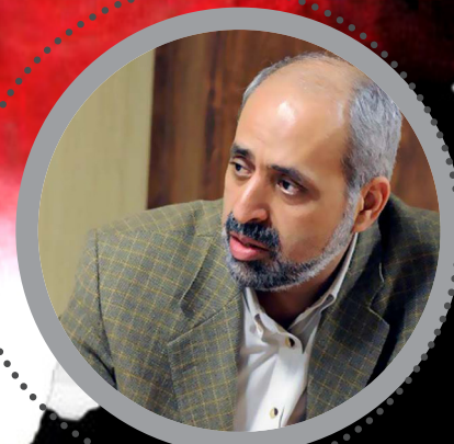
بکارگیری فن آوری‌های پیشرفته در فرآیندهای خدمات سلامت کار

شب یلدا شد و میلاد خوش ایندو مهر زایش نور از این خلقت تاریک مهر شب یلدا شد و بر سفره‌ی یلدا، شوق بجاست سینه‌درد برشی دلگداز شوق شب یلدا جان رسانده و زخمانده ماد