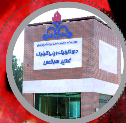
از سرخس تا کناره‌های دریای عمان