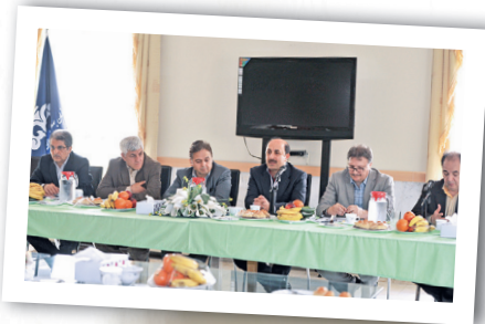
دکتر سمیع: سازمان مکلف به کاهش تصدی گری در بخش های غیر عملیاتی است