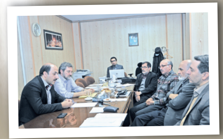
تصویب سند جامع خدمات سلامت روانی، اجتماعی در صنعت نفت